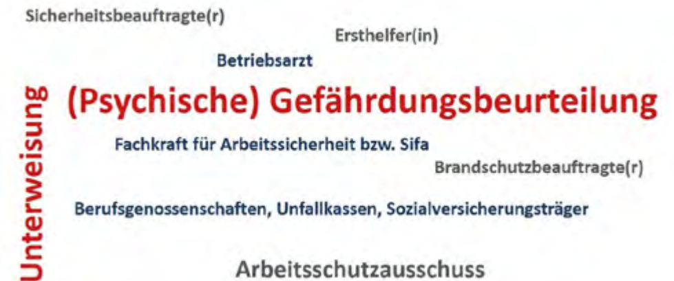
Abbildung 2: Wortwolke Arbeitsschutz (Eigene Darstellung, 2021)